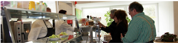
Kantine Ebnatfeld Kantimensa